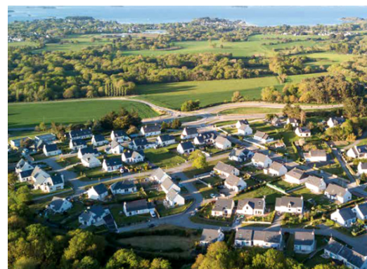
« Rénover et densifier les quartiers d'habitats pavillonnaires » PROFEEL / Rennes Métropole, Pays des Vallons de Vilaine, DR © CAUE 74