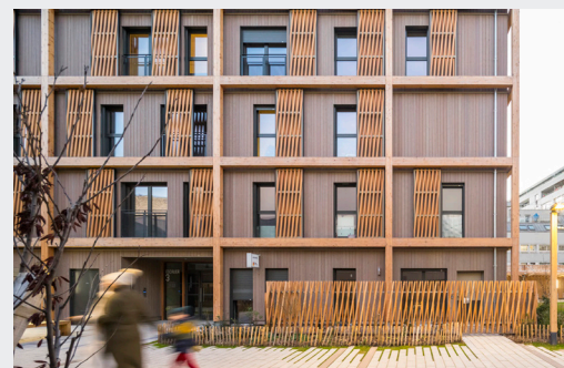
Réhabilitation d'un ancien parking en logements à Jaurès Petit à Paris 19 / MOA : Paris Habitat OPH Architectes : Archi 5 PROD (logements sociaux) et Encore Heureux (logements en accession)

Élus, filières agricoles-sylvicoles et industrielles, maître d'ouvrages publics et privés, architectes, entreprises du bâtiment